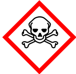
GHS06 Totenkopf mit gekreuzten Knochen