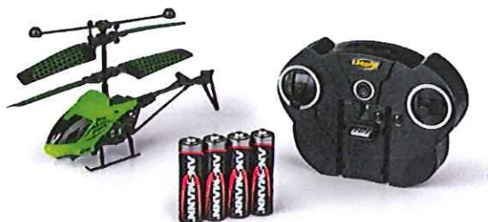
Immagine del prodotto:

è conforme ai requisiti previsti dalle direttive e dai regolamenti seguenti: