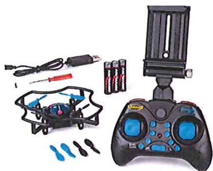
Immagine del prodotto:

è conforme ai requisiti previsti dalle direttive e dai regolamenti seguenti: