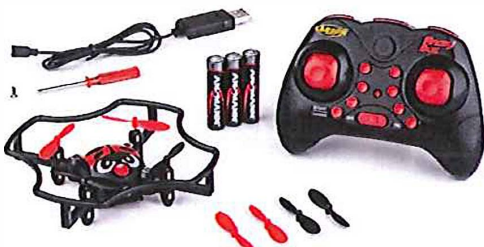
Immagine del prodotto:

è conforme ai requisiti previsti dalle direttive e dai regolamenti seguenti: