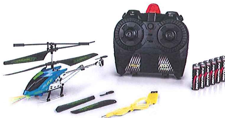
Immagine del prodotto:

è conforme ai requisiti previsti dalle direttive e dai regolamenti seguenti: