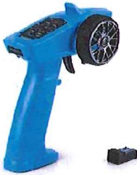
Immagine del prodotto:

è conforme ai requisiti previsti dalle direttive e dai regolamenti seguenti: