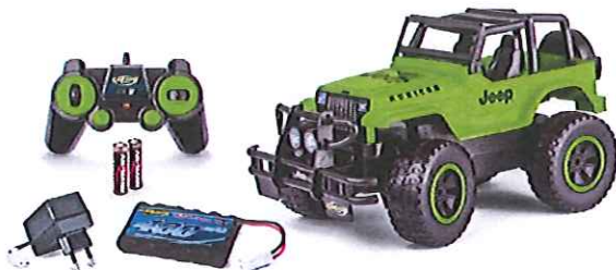
Immagine del prodotto:

è conforme ai requisiti previsti dalle direttive e dai regolamenti seguenti: