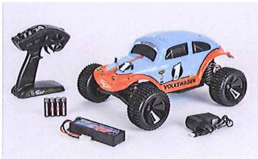
Immagine del prodotto:

è conforme ai requisiti previsti dalle direttive e dai regolamenti seguenti: