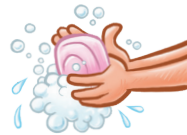
4) Hände waschen